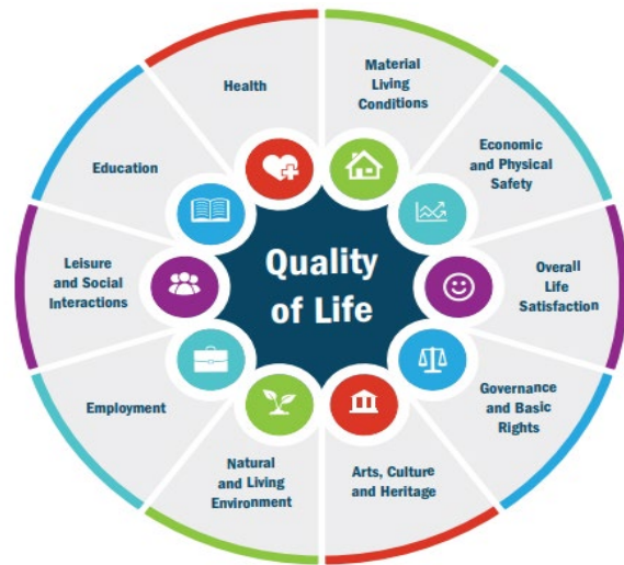
Figiúr 7.2: Gnéithe a thacaíonn le caighdeán na beatha

Tá an Plean Forbartha tiomanta do thacú le forbairt pobail shláintiúla agus ghníomhacha, áit a bhfuil deiseanna ann don phobal iomlán a bheith sláintiúil agus gníomhach ag gach céim den saol. Tríd na beartais sa Plean, tugtar tacaíocht do raon beart a chuideoidh le pobail shláintiúla lena n-áirítear iad siúd a chosnaíonn agus a fheabhsaíonn an comhshaol, a chuireann infhaighteacht agus inrochtaineacht áiseanna pobail chun cinn agus bonneagar soghluaisteachta inbhuanaithe agus tacaíocht bheartais chun soláthar saoráidí cúram sláinte a éascú, chun rochtain ar chúram sláinte a chumasú.