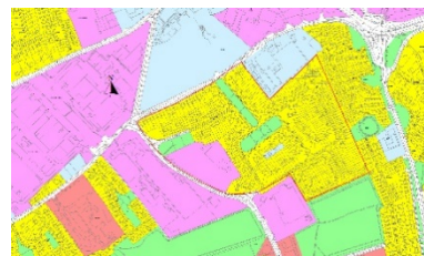
Figiúr 3.4: Mervue

Tá deiseanna ann chun feabhsuithe comhshaoil a bhaint amach ar thaitneamhacht chónaitheach agus amhairc i gceantar Mervue. Scrúdóidh an Chomhairle, i gcomhar le cónaitheoirí áitiúla, an acmhainneacht le haghaidh feabhsuithe comhshaoil do cheantar Mervue (féach Figiúr 3.4) trí fheabhsuithe ar shábháilteacht agus áisiúlacht nasc, ríocht phoiblí fheabhsaithe, glasú uirbeach agus deiseanna do bhonneagar glas agus bithéagsúlacht feabhsaithe.