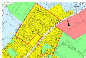
Figióir 3.7 An Bóthar Mór

Aithnítear go mbainfeadh na ceantair sin go háirithe, Seantalamh, an Cladach agus an Bóthar Mór, leas go príomha as feabhsuithe ar an ngréasán coisithe agus sráide. Is féidir le cur i bhfeidhm na gcuspóirí sa GTS agus i Straitéis um Ríocht Phoiblí (PRS) na Gaillimhe, go háirithe maidir le feabhsúcháin iompair inbhuanaithe, plandú sráide agus bearta glasaithe uirbeacha, feabhas a chur ar thaitneamhachtaí ginearálta na gceantar seo. Is féidir leis na bearta seo freisin feabhas a chur ar shláinte agus ar fholláine na gcónaitheoirí a thacaíonn le taisteal gníomhach agus le cáilíocht an aeir feabhsaithe trí úsáid charranna a laghdú ar shráideanna áitiúla. Cinnteoidh tionscadail straitéiseacha eile ar nós Scéim Faoisimh Tuilte na Gaillimhe ‘Coirib go Cósta’ go mbeidh comharsanachtaí, go háirithe an Cladach, in ann teacht aniar i gcoinne tionchair an athraithe aeráide.