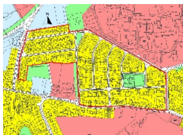
Figióir 3.5 Seantalamh