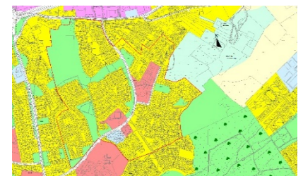
Figiúr 3.3: An Baile Bán

I gceantar an Bhaile Bháin, tá deiseanna ann chun feabhsuithe a bhaint amach agus an fhéidearthacht ann le haghaidh forbairt inlíonta (féach Figiúr 3.3). Sa chás seo déanfar athbhreithniú ar dheiseanna athghiniúna go háirithe ar phócaí beaga de spás oscailte a bhfuil luach íseal pobail, taitneamhachta agus áineasa acu. Ullmhófar plean athghiniúna áitiúil i gcomhar le comhairliúchán pobail agus ní bhreithneofar aon fhorbairt ach amháin nuair a chuireann sé le comhforbairt áite agus le luach pobail agus nuair a chuireann sé feabhas ar cháilíocht na comharsanachta. I gcás go bhfuil tithíocht chun dul i ngleic leis an riachtanas atá i réim, mar chuid den mholadh, beidh gá le meascán de mhéideanna agus de chineálacha aonad tithíochta a sholáthar.