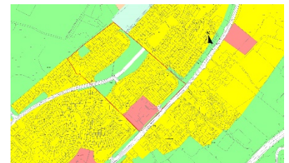
Figiúr 3.2: Baile an Phoill

Go sonrach, tá deiseanna ann chun feabhsúcháin a bhaint amach i gcomharsanacht Bhaile an Phoill mar a aithníodh sa dréachtphlean athnuachana do Bhaile an Phoill dar teideal A Better Ballinfoile/Baile an Phoill Níos Fearr. Leagadh béim ann ar roinnt gníomhaíochtaí sa chomharsanacht agus dá gcuirfí i bhfeidhm iad, thiocfadh feabhas suntasach. Tá an acmhainneacht seachadta ag formhór na ngníomhartha seo toisc go bhfuil siad suite ar thailte poiblí. Tá sé mar chuspóir ag an gComhairle an plean seo a athbhreithniú i gcomhairle leis an bpobal (féach Figiúr 3.2).